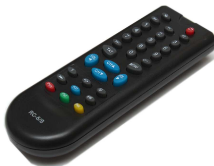
Рис. 3. Пульт RC-5/S.