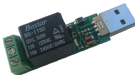
Рис. 1. Общий вид устройства.