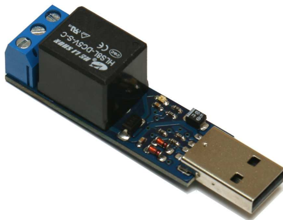
Рис. 1. Общий вид устройства.