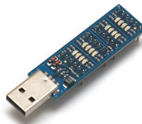
Рис. 1. Общий вид устройства.